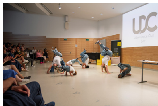
Breaking-Session mit dem Urban Dance Club Linz