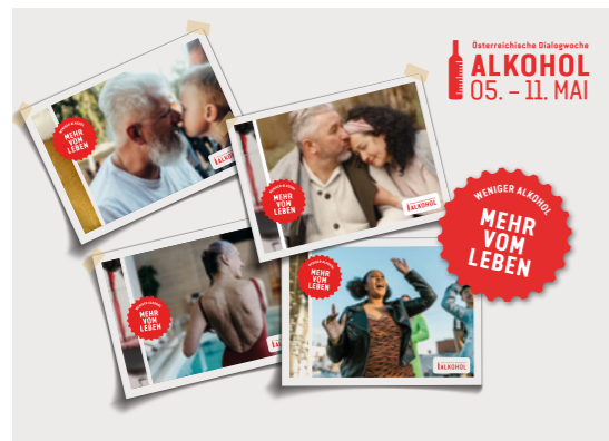
Für die 5. Dialogwoche Alkohol wurden neue Postkarten mit dem Motto „Weniger Alkohol – mehr vom Leben“ aufgelegt. Darauf finden sich nützliche Tipps und Botschaften zur Konsumreduktion.

→ Bereits zum fünften Mal bot die Dialogwoche Alkohol im Rahmen zahlreicher Veranstaltungen die Möglichkeit, sachlich über das Thema Alkohol zu informieren, zum Nachdenken über den eigenen Konsum anzuregen und die Vorteile eines maßvollen Umgangs aufzuzeigen – diesmal unter dem Motto: „ Weniger Alkohol, mehr vom Leben “. Die Österreichische Dialogwoche 2025 wurde in Oberösterreich vom Institut Suchtprävention, pro mente OÖ in Kooperation mit dem Land OÖ koordiniert. Neben dem langjährigen Partner ÖGK unterstützte erstmals auch die Apothekerkammer Oberösterreich als Kooperationspartner diese Aktion!