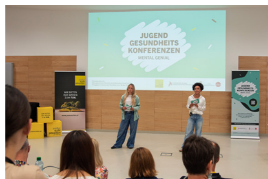
Moderationsduo des UDC

Die Jugendgesundheitskonferenzen sind eine Maßnahme im Rahmen der österreichweiten Vorsorgestrategie – finanziert aus Mitteln der Bundesgesundheitsagentur – und werden in Oberösterreich vom Institut Suchtprävention, pro mente OÖ in Kooperation mit dem Land OÖ und der Bildungsdirektion OÖ durchgeführt. Weitere Kooperationspartner waren im Jahr 2025 die Pädagogische Hochschule Oberösterreich sowie die Education Group GmbH.