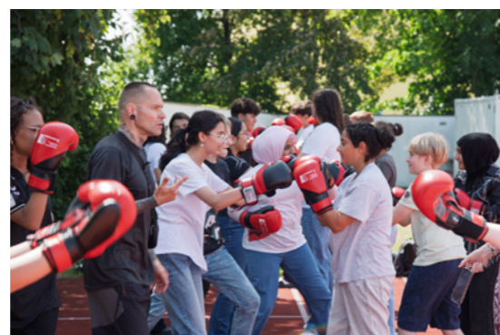
Impressionen aus den Box-Workshops