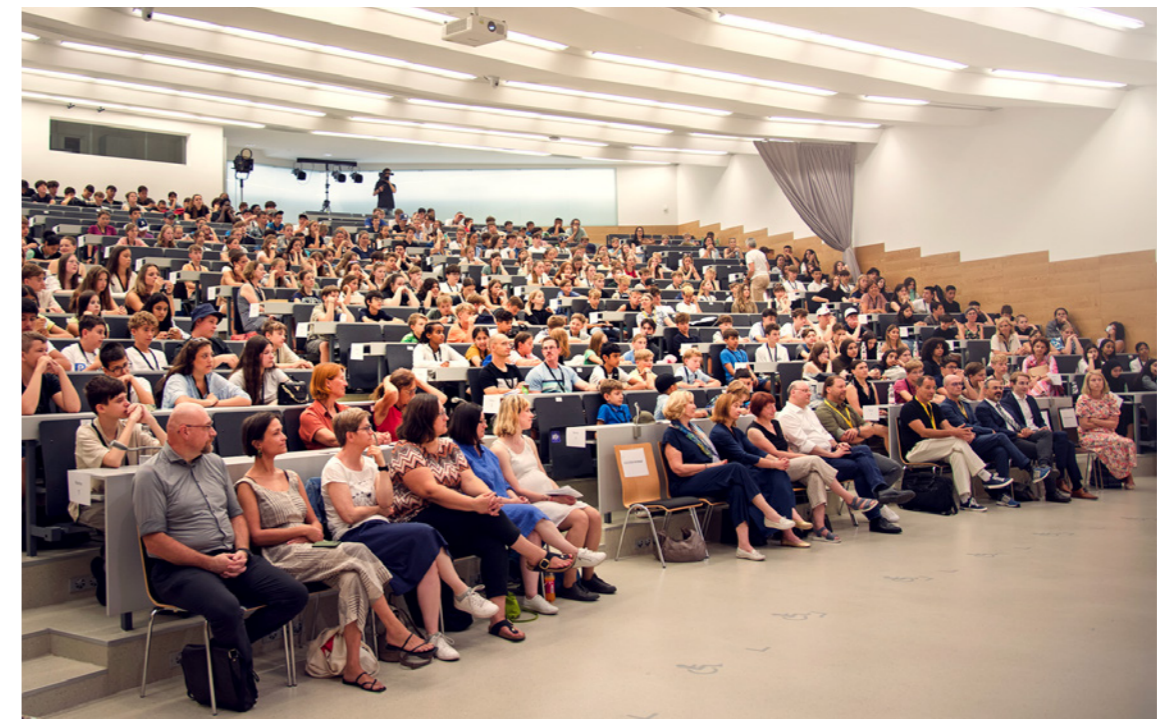
Jugendgesundheitskonferenz - Mental Genial: Der große Hörsaal 1 an der PH OÖ war vollbesetzt.

Das Highlight des Jahres 2025 war aus Sicht des Instituts Suchtprävention mit Sicherheit die gelungene Umsetzung der ersten „ Jugendgesundheitskonferenz – Mental Genial “. Diese neue Initiative bietet zwischen 2025 und 2028 die Chance, Jugendliche in Oberösterreich über selbständig erarbeitete Projekte sowie mittels kreativer und nachhaltiger Ansätze in ihrer psychischen und psychosozialen Gesundheitskompetenz zu stärken. Der Zuspruch war bei der Premiere im Vorjahr hoch: Mehr als 1.100 Jugendliche zwischen 12 und 20 Jahren haben im Frühjahr 2025 dazu eigenständig mit großem Elan Projekte zur Förderung der psychischen Gesundheit entwickelt. Diese wurden am 26. Juni 2025 im Rahmen der Abschlussveranstaltung zur ersten oö.