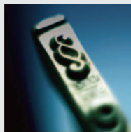
Schulrecht und Jugendschutz