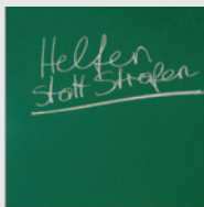
Handeln nach §13 SMG